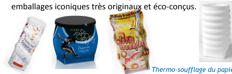
Thermo-soufflage du papier Fibre Form

Machine de gaufrage et thermo-soufflage de carton à installer en amont de vos lignes de remplissage pour conditionnement de granulés, poudres petites pièces ainsi que produits surgelés.