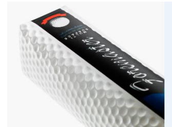
Gaufrage du papier Fibre Form